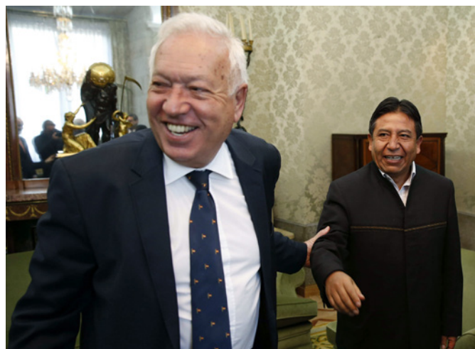
El ministro de Asuntos Exteriores y de Cooperación junto a su homólogo boliviano, David Choquehuanca, durante su visita a Madrid en enero de 2015.

Vicepresidente de Bolivia: Álvaro García Linares