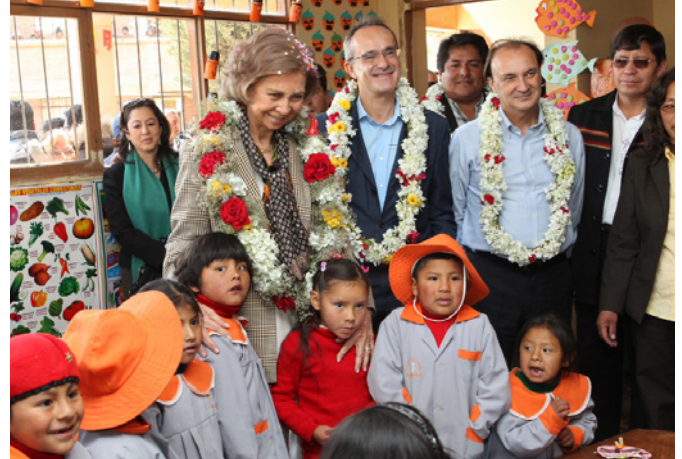
S.M. la reina doña Sofía, junto al embajador de España, Ángel Vázquez, y el secretario de Estado, Jesús Gracia, durante su visita la Unidad Educativa “España” en el marco de su viaje oficial a Bolivia en octubre de 2012.

Las relaciones bilaterales de Bolivia con España pueden calificarse de buenas. El ambicioso programa de cooperación al desarrollo y de asistencia financiera, la inversión en sectores clave de la economía, la oferta de becas, la acción