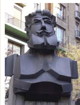
Monumento a Joaquín Costa

Joaquín Costa, La tierra y la cuestión social (1914). Texto adaptado