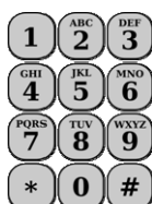
Teclado de teléfono móvil

La mayor parte de los usuarios de este tipo de telefonía acaba, en gran medida, dominando ese tipo de lenguaje. A pesar de eso, cada uno de nosotros empleamos nuestras propias particularidades. No obstante, para facilitar más su uso, se han creado diccionarios que tienes a tu disposición en páginas de Internet, como estas: